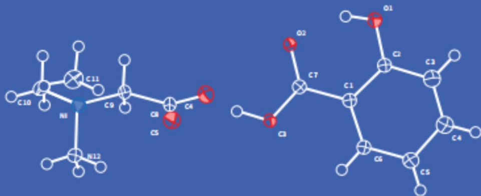
超分子甜菜碱水杨酸共晶 (单晶衍射图)